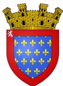
Département de la Sarthe

Prenons le blason du département de la Sarthe qui entre dans la composition de celui de Fontenay tel que nous le proposons ici. Il reproduit intégralement celui de l'ancienne province du Maine dont le Mans était la capitale, et qui lui-même n'est que le blason des comtes du Maine, dont la généalogie n'est pourtant pas particulièrement chère à la majorité des sarthois. Remarquons également la couronne murale qui met en évidence l'appropriation des armoiries par un territoire (ville, village, région,...), à la différence de la couronne de métal et de pierres précieuse qui représente le titre nobiliaire du chef de famille.