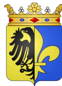
Marquis de Bastard de Fontenay

Le blason utilisé de manière continue dans le village est celui du marquis de Fontenay. Or, il est d'usage en héraldique que les territoires s'approprient les armoiries du seigneur local, même et surtout s'ils ne dépendent plus de lui. Elles deviennent ainsi le symbole d'une collectivité et non plus d'une personne ou d'une famille. Cela est bien sûr encore plus manifeste lorsqu'une famille ou un titre nobiliaire disparaît, laissant à la seule collectivité l'usage du blason. Les exemples sont extrêmement nombreux, puisqu'il en est ainsi pour presque tous les départements et toutes les régions de France.