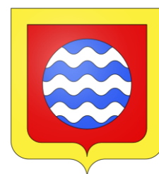
Prieuré de Fontenay

Par ailleurs, les armoriaux recensent également un blason pour le prieuré de Fontenay. Ce blason est parlant , ce qui signifie qu'il illustre le nom du lieu: la figure qui est représentée est une fontaine. Il semble que ce blason ait été attribué relativement récemment, sous l'ancien régime, peut-être pour des raisons fiscales. Quoi qu'il en soit, il pourrait tel quel servir à la paroisse de Fontenay, puisqu'elle est l'héritière du prieuré ; pour la communauté civile en revanche, il fallait des armoiries propres.